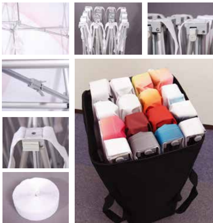
【ナイロンキャリーバッグ(付属)】

イベントや展示会・ショールームなど様々な場所での利用で最大のコストパフォーマンスを発揮いたします。