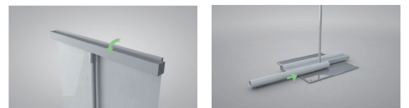
上下はめ込み式で簡単交換